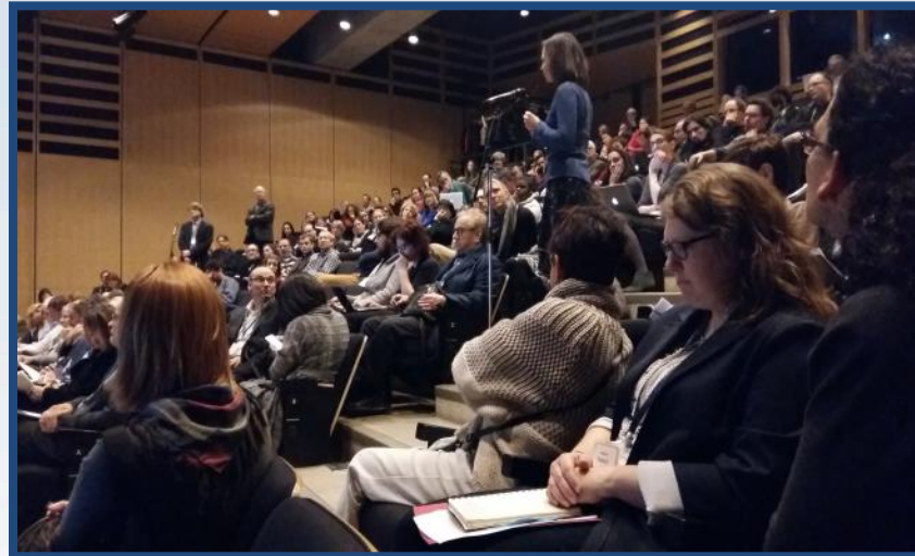
Forum Les chercheurs dans la sphère publique, FRQ, décembre 2015